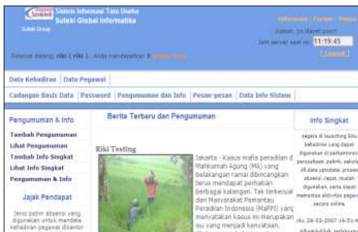
Tampilan halaman sistem informasi kehadiran

Selain pengelolaan informasi kehadiran pegawai, Sistem Informasi Kehadiran ini juga mempunyai fasilitas komunikasi antar pegawai berupa buat/terima pesan, lihat/buat info singkat serta pengumuman.