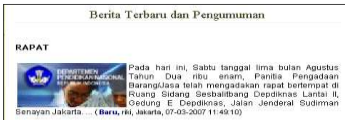
Gambar Berita halaman depan