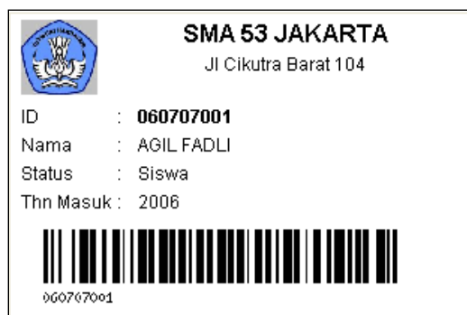
Contoh kartu pelajar

SI Kehadiran Sekolah juga menyediakan fasilitas untuk mencetak kartu pelajar (kartu siswa) secara otomatis.