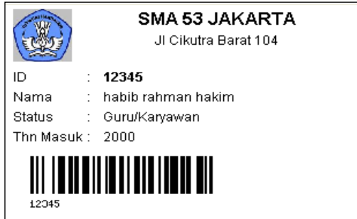
Contoh kartu identitas guru