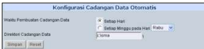
Gambar konfigurasi cadangan data otomatis