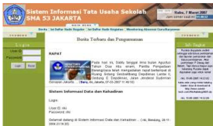
Tampilan halaman utama sistem informasi kehadiran sekolah

Selain pengelolaan informasi kehadiran siswa, guru dan karyawan, Sistem Informasi Kehadiran sekolah ini juga dilengkapi pengelolaan informasi kehadiran kegiatan-kegiatan lainnya (misal ekstra kurikuler) serta fasilitas komunikasi antar pegawai berupa buat/lihat info singkat serta pengumuman.