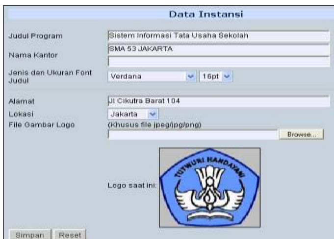
Gambar Update Data Sistem

Data instansi digunakan untuk mengatur informasi dan tampilan program sehingga sesuai dengan instansi Anda.